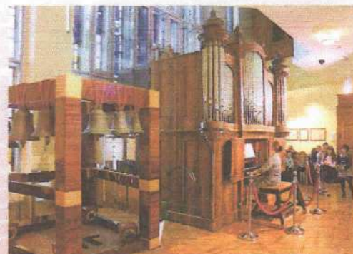
На 1-й странице обложки: Российский национальный музей музыки, Москва. Орган мастера Фридриха Ладегаста. Изготовлен в 1868 году.