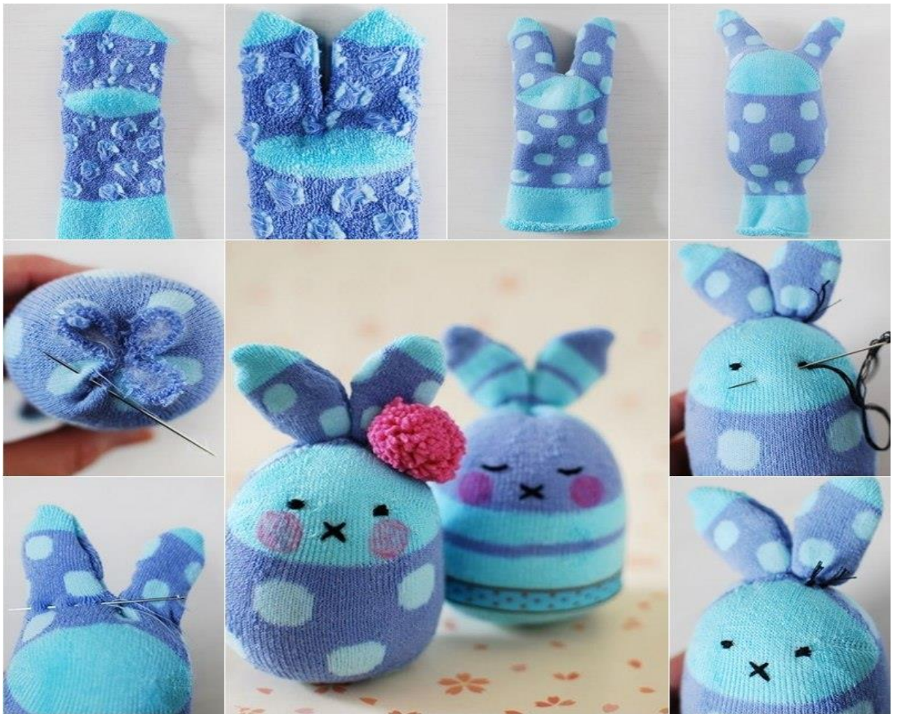
Игрушки из помпонов своими руками для детей